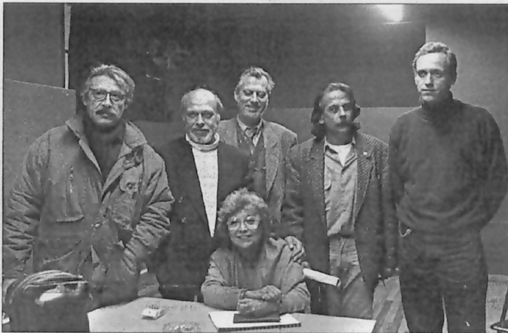
Els actors de "Amanda", amb el director de l'espectacle i l'autor de l'obra, ahir al migdia a la Sala Beckett

L'última intervenció d'Amparo Soler Leal al món del teatre data de l'any 1978, quan l'actriu va fer La senyoreta Júlia al Teatre Poliorama de Barcelona. "Estic molt contenta de tornar", va manifestar ahir l'actriu, "i encara més de fer-ho a Barcelona". Aquests quinze anys sense trepitjar un escenari Amparo Soler Leal els ha passat dedicada al cine, però, segons va assenyalar ahir al migdia, amb unes ganes tremendes de tornar a fer teatre. "Els meus pares, que eren còmics, n'estarien orgullosos", va indicar l'artista.